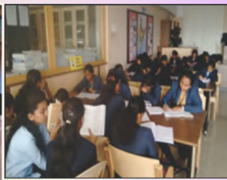
Students article writing