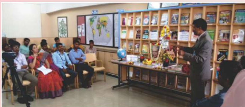
Principal speech on Librarians Day