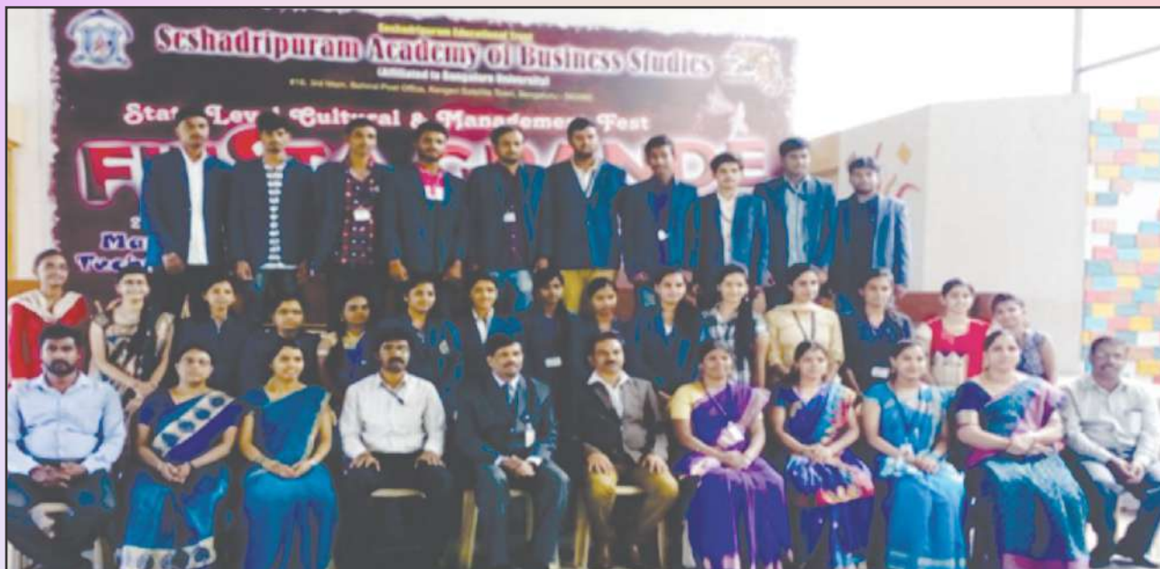
Library Committee members Faculty and Student's Unique feature of Library and Information Centre: