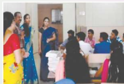
ORIENTATION PROGRAMS FOR 1 ST YEAR STUDENTS