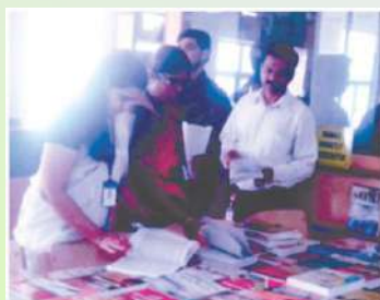
REFERENCE BOOKS EXHIBITION